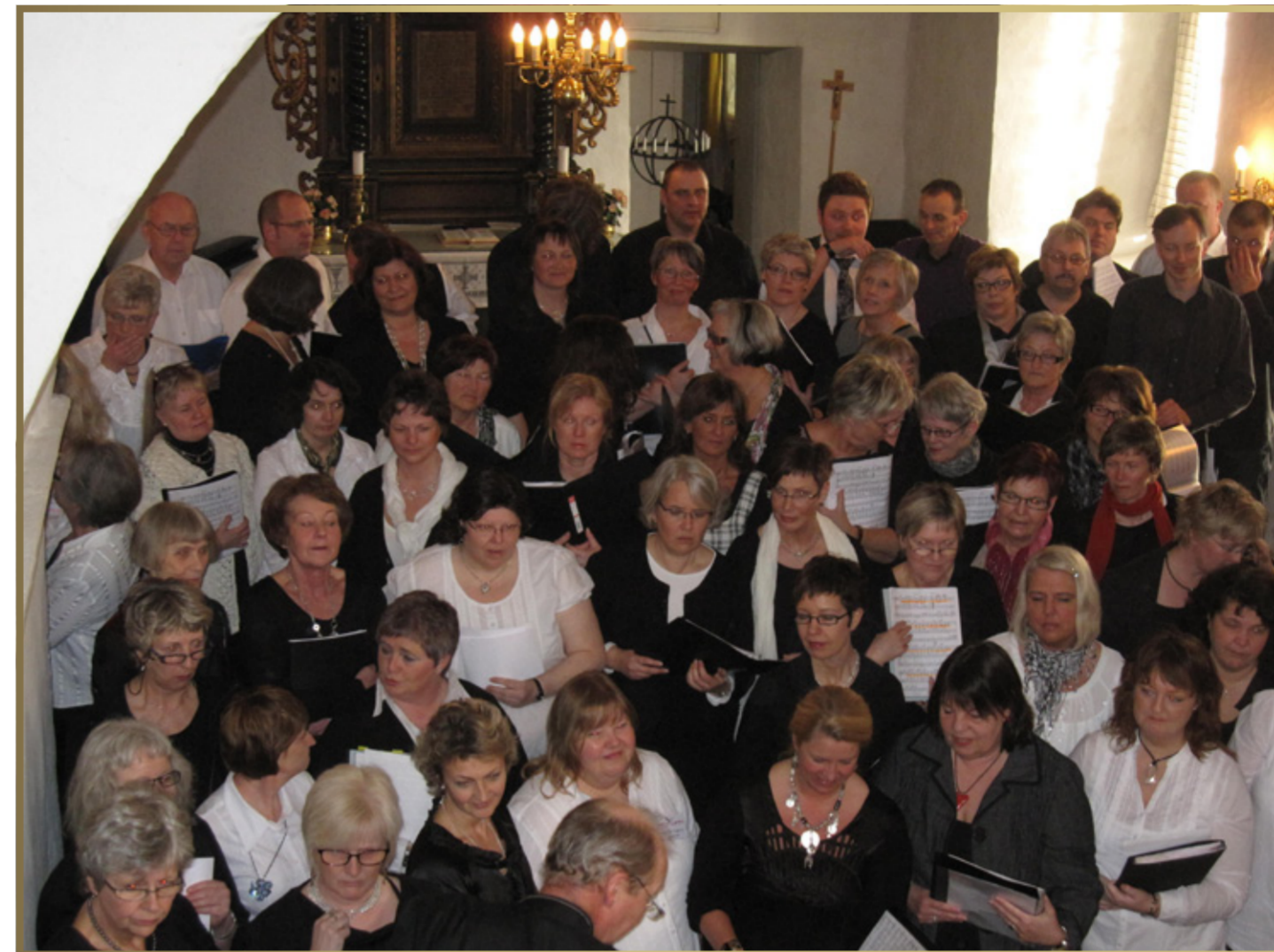
Haldenskoret «Pico Canto» i aksjon på sangkvelden i mars.

Alt dette – og mye, mye mer – er menighetslivet på Idd! Idd kjennetegnes – kort sagt – av «en gammel kirke og livsfrisk menighet»!