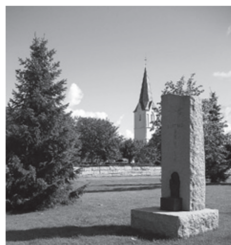
Minnelunden på Asak kirkegård

Et eget området på minnelunden er i tillegg satt av til anonyme graver for voksne. Det hender nemlig i blant at det blir uttrykt et ønske om en navnløs grav.