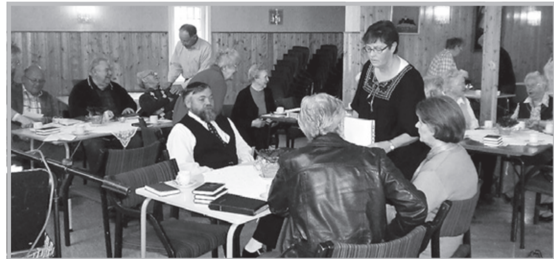
Karsholm er en sosial møteplass med med bl.a. god bevertning.