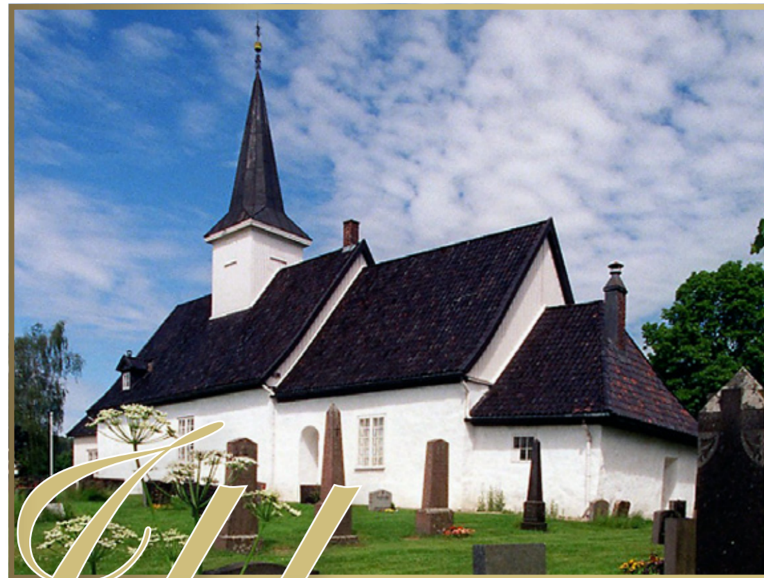
En gammel middelalderkirke...