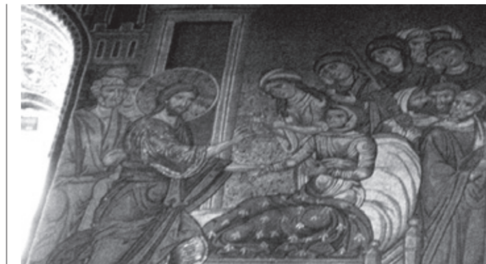
I Monreal på Sicilia finner man et kunstverk av mosaikk som illustrerer underet da Jesus som vekker enkens sønn fra de døde.

Hun har ikke de samme levevilkårene, hun som bor i den lille byen Nain. Å være enke i hennes hjemland er vanligvis ensbetydende med å befinne seg på samfunnets nederste trinn på rangstigen. Hun er fattig og har ingen til å forsørge seg. Hun og ektefellen fikk en sønn før