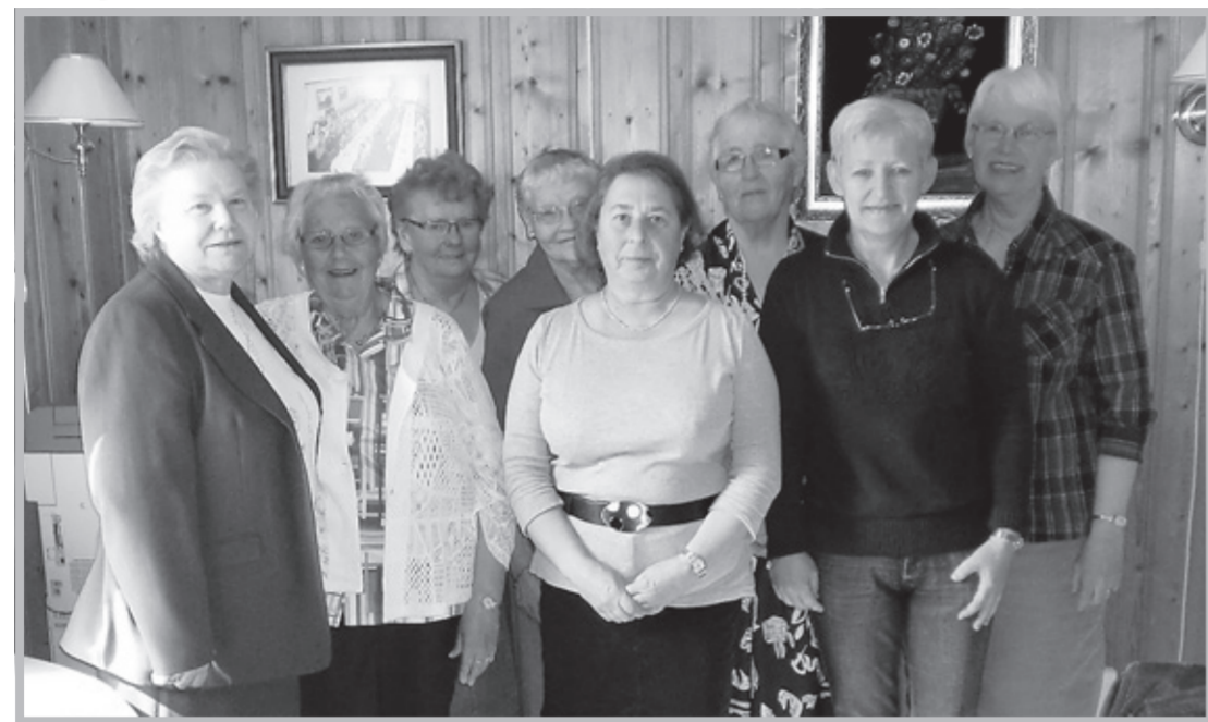
Damene i Idd kvinneforening anno 2010.

Gjennomsnittsalderen er høy, men omtanken for nærmiljøet kan også uttrykkes ved telefonbesøk når det er