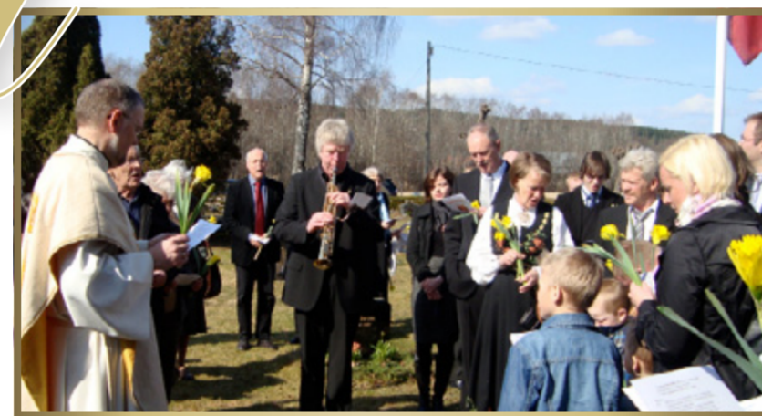
... en livsfrisk menighet fordi Jesus lever. Påskedagssang på kirkegården.

En 900-årig historie innebærer naturligvis også forandringer. Middelalderens Idde-menighet hadde neppe sett for seg at dåpsbarn i 2010 kunne bli båret til døpefonten