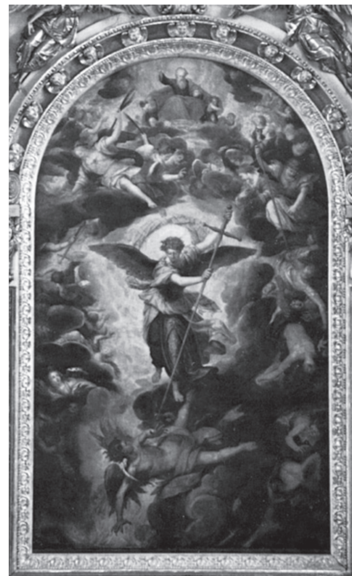
Erkeengelen Mikael, her illustrert i et alterbilde fra 1588, av Christoph Schwartz.

På nordveggen i koret i Idd kirke, ved siden av et krusifiks fra 1200-tallet, står det en noe medtatt treskulptur på en liten hylle. Det er «St. Mikael i Idd», skåret av en ukjent treskjærer for rundt 800 år siden.