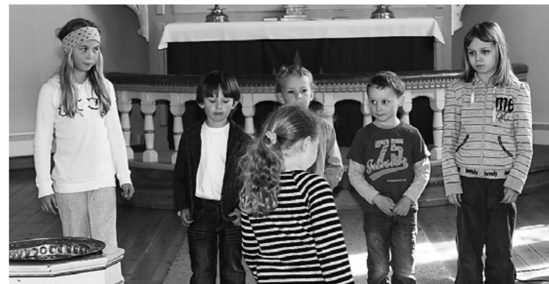
«Minikonser» med Asak barnekor.