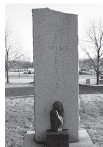
«Bønn for menneske»

Da Halden kirkelige fellesråd vedtok å opprette en minnelund, så langt tilbake som 17. september 1998, lå det nemlig i kortene at dette skulle bli en kommunal minnelund, - et gravfelt for hele kommunen. Tanken bak denne minnelunden er å komme dem til hjelp, som mister et barn før fødselen eller mens barnet er lite. På minnelunden kan en velge om en vil ha en ordinær barnegrav eller en anonym grav. Minnelunden på Asak kir-